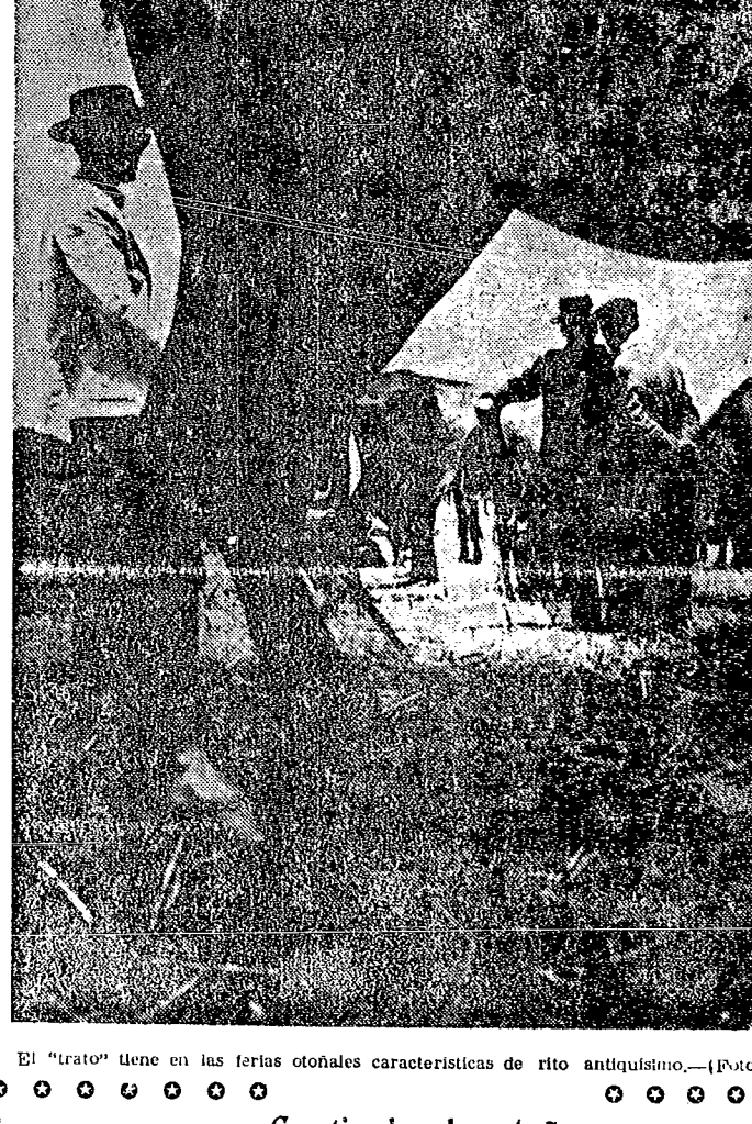
El "trato" tiene en las ferias otoñales características de rito antiquísimo.—(Foto)